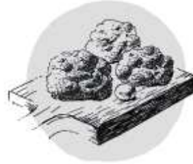
Bacon Cheddar Milk Biscuits with Maple Butter (1 piece) ベーコンチェダービスケットと メープルバター1P 120