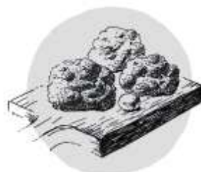
Bacon Cheddar Milk Biscuits with Maple Butter (1 piece) ベーコンチェダービスケットと メープルバター1P 120